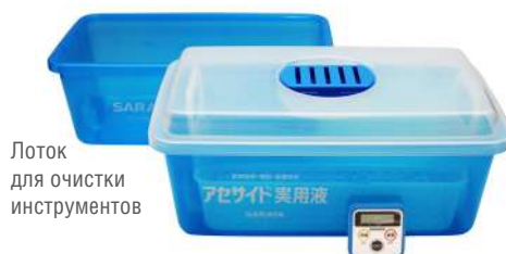
Лоток для замачивания в рабочем растворе АСЕСАЙД