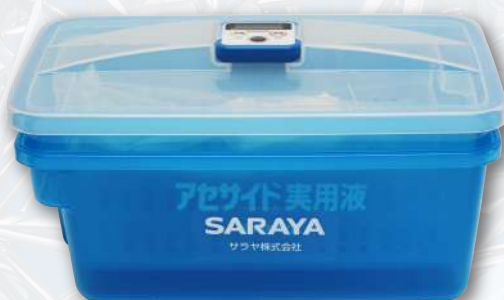
Комплект лотков для обработки инструментов AS-3 (3 л)

Удобное и эффективное решение для быстрой дезинфекции и стерилизации медицинских инструментов