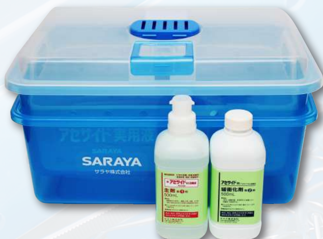
Комплект лотков для обработки инструментов AS-10 (10 л)

Комплекты лотков для дезинфекции и стерилизации изделий медицинского назначения с использованием препарата АСЕСАЙД