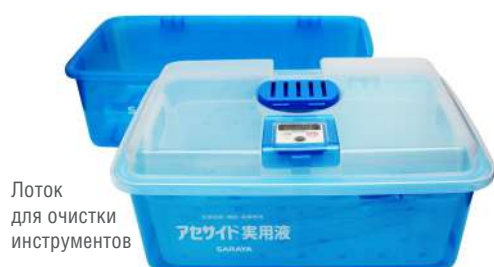
Лоток для замачивания в рабочем растворе АСЕСАЙД