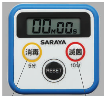
Установленное время дезинфекции (5 минут) Установленное время стерилизации (10 минут) Кнопка перезагрузки