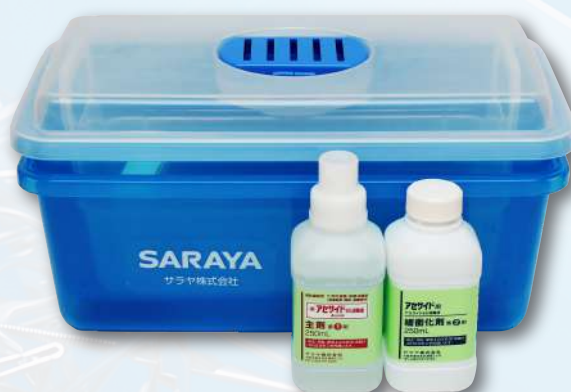
Комплект лотков для обработки инструментов AS-5 (5 л)