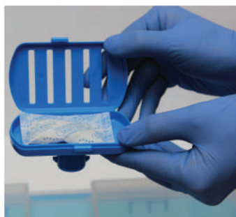
Поместите дезодорант, прилагающийся к АСЕСАЙД, в дезодорирующую насадку для подавления характерного запаха раствора АСЕСАЙД