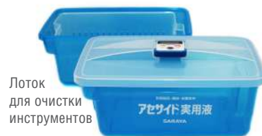
Лоток для замачивания в рабочем растворе АСЕСАЙД