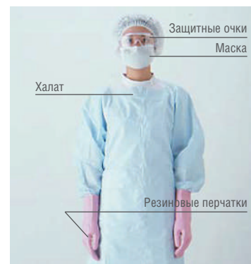
Защитные очки Маска Халат Резиновые перчатки

Перед подготовкой к дезинфекции / стерилизации рабочим раствором АСЕСАЙД наденьте средства индивидуальной защиты, например, защитные очки, перчатки из ПВХ или резиновые, защитную маску или респираторы универсального типа РПГ 67 или РУ 60М с патроном марки В, защитный халат.